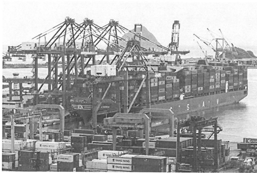
貨輪相關資料照。

更新: 2020-07-29 10:50 PM 標籤: 加拿大, 包裹, 種子, 中華郵政, 貨轉郵