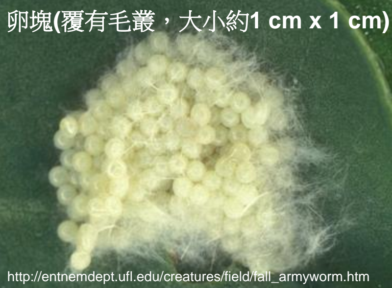
卵塊(覆有毛叢，大小約1 cm x 1 cm)

http://entnemdept.ufl.edu/creatures/field/fall_armyworm.htm