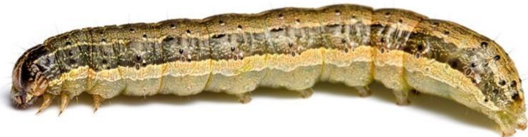
幼蟲(剛孵化約2mm，化蛹前約3.2cm)

http://entnemdept.ufl.edu/creatures/field/fall_armyworm.htm