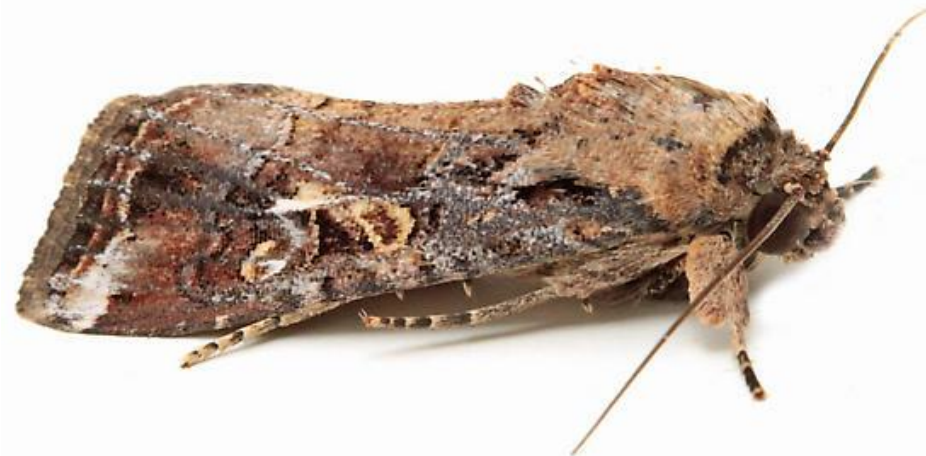
成蟲(含翅體長約3cm，展翅寬約3-4cm)